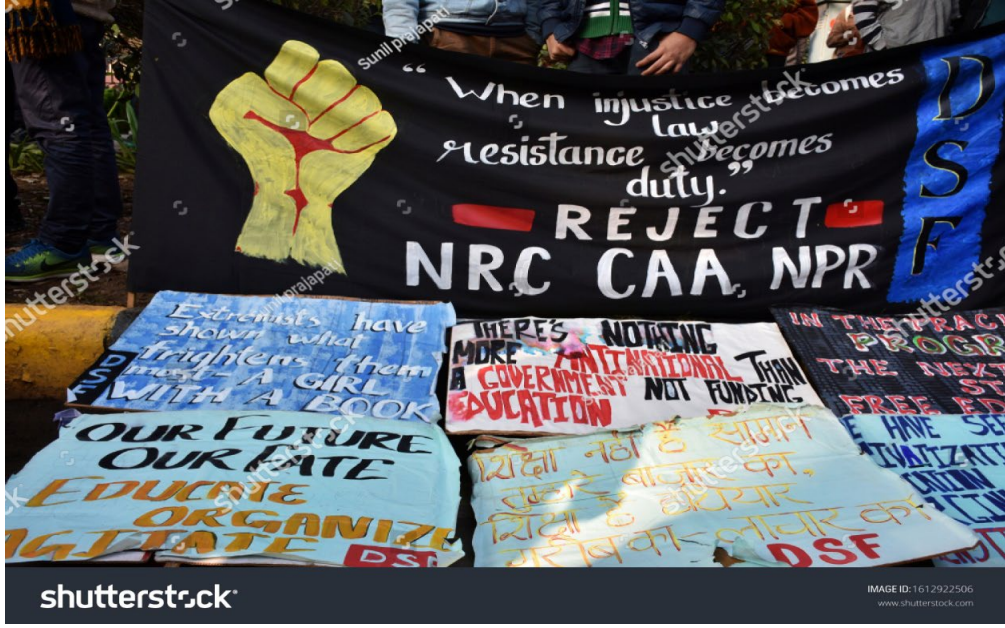
Resim 3: CAA'ya karşı yapılan protestolarda protestocular tarafından kullanılan afişler

Ancak 24 Mart 2020'den itibaren Hindistan'ın, COVID 19 saldırısı sebebi ile karantina süreci başladığından protestocular sokak eylemlerine aniden son vermek zorunda kaldılar (Sharma, 2020). Bazı eleştirmenler ise Başbakan Narendra Modi hükümetini, özellikle direniş ve protesto yapılması neredeyse imkânsız hale geldiğinde, "azınlık protestoları ve toplumsal katliamla ilgili konularda siyasi gündemi" sürdürmek için karantina dönemini "çok alaycı" bir şekilde kullanmakla suçladı (Bisht, 2020).