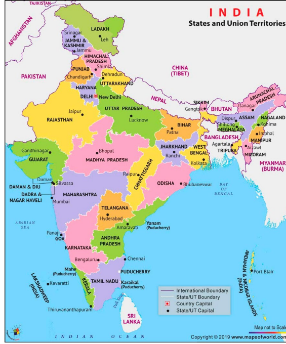
Resim 1: Hindistan'ın eyaleti ve birlik bölgelerin haritası

Hindistan sadece yukarıda bahsedilen çeşitliliklerinin yanı sıra, aynı zamanda çok dillilik politikasını takip eden çok kültürlü, çok dinli bir devletin klasik bir örneği olması açısından da önemlidir (Sengupta, 2009:1). Hindistan, farklı dil gruplarının dillerini ve kültürlerini korumalarına ve geliştirmelerine yardımcı olacak şekilde kendi yasalarını ve politikalarını formüle etmek için eyaletlere belirli bir özerklik derecesi sağlamak üzere, bağımsızlıktan sonra federal bir hükümet biçimi benimsemiştir. Hindistan Federal yapısında, alt ulusal birimler-Hindistan Birliği'ni oluşturan eyaletler-esas olarak dilsel esasa dayanarak oluşturulmuştur.